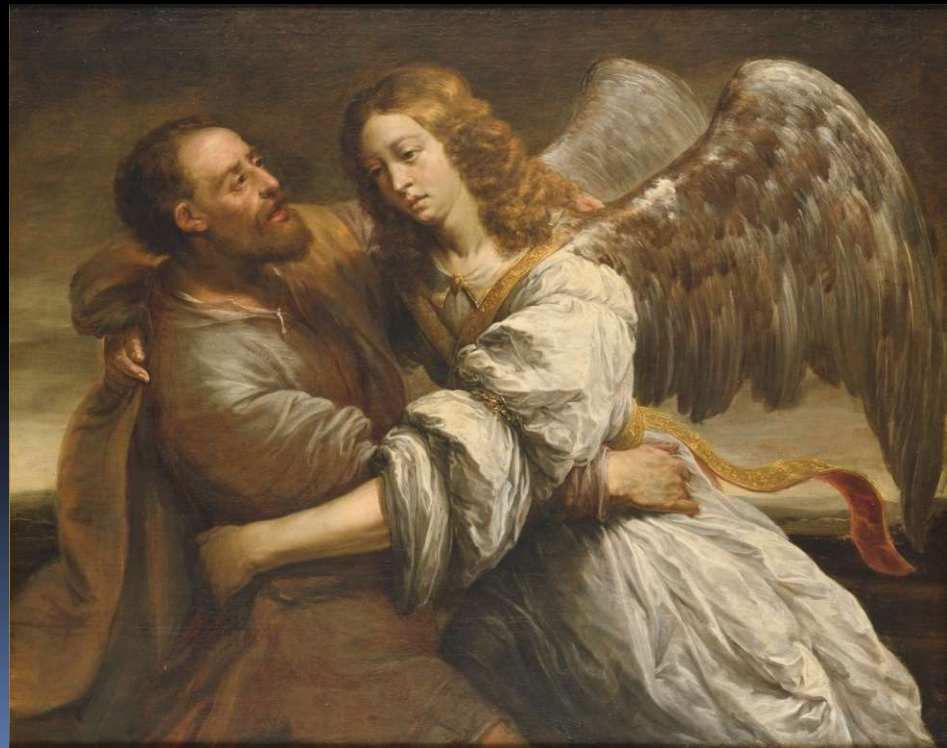
Jacob Fighting the Angel by Juriaen Ovens (1623~78) at Nationalmuseum, Stockholm, Sweden

這篇標題是大衛的禱告(參詩86.1, 142.1, 90.1, 102.1), 有哀歌的成份(17.9-14), 但它又不是哀歌, 而是求神受理他的案件(17.1), 不僅如此, 他在最後一節發出人一生可有最崇高的禱告: 「在義中見神的面, 有祂的形像。」