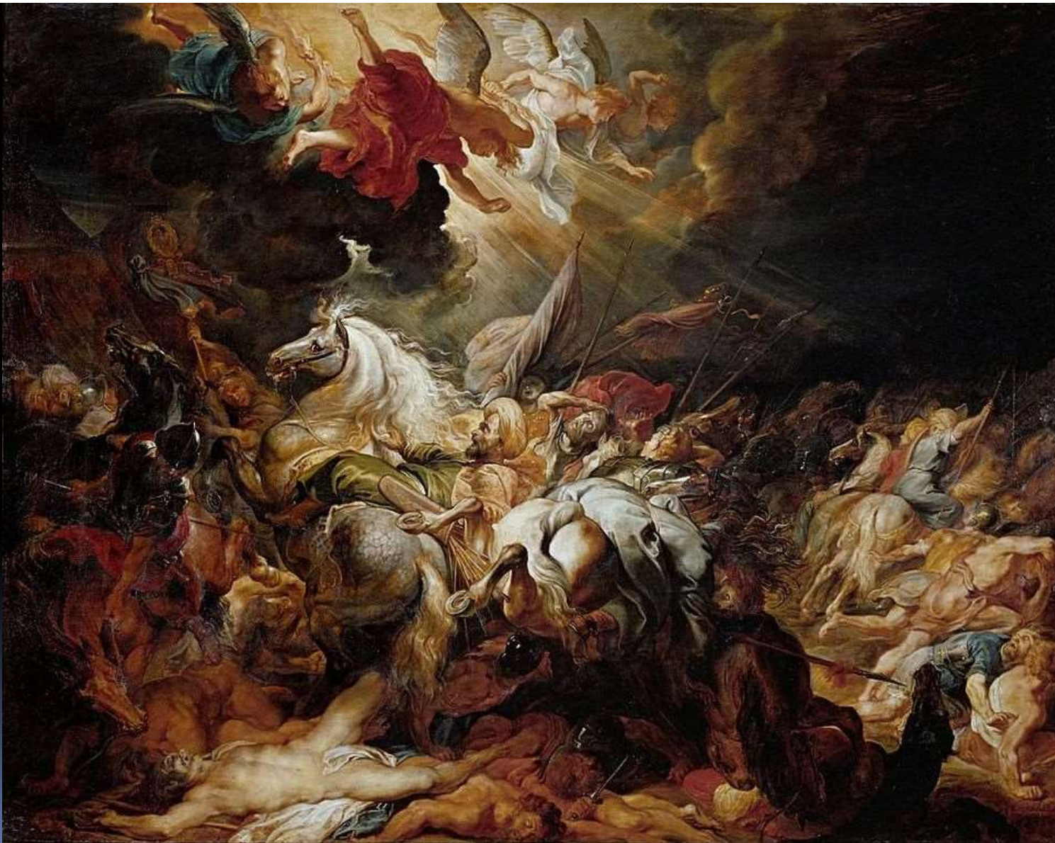
The Defeat of Sennacherib by Peter Paul Rubens 1600~40 at Alte Pinakothek. 2 Kings 19.35-37